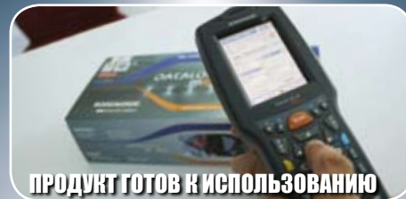
ПРОДУКТ ГОТОВ К ИСПОЛЬЗОВАНИЮ